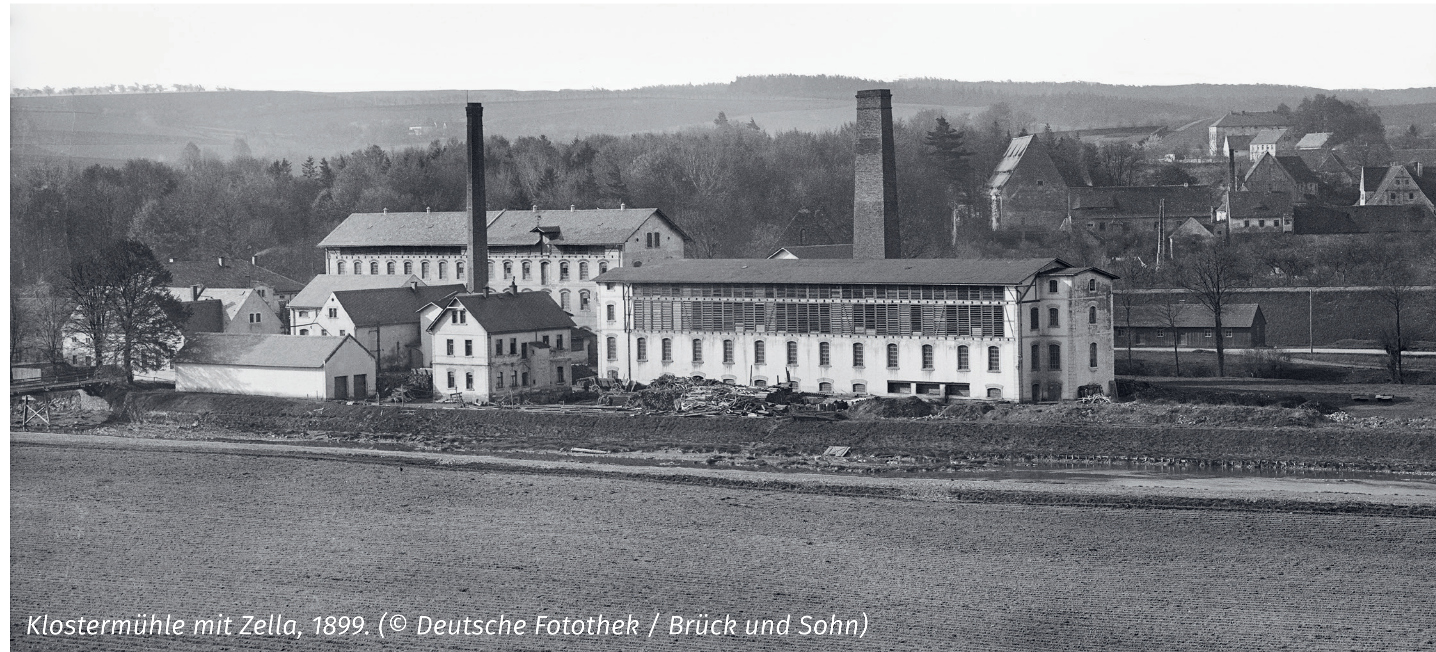
Klostermühle mit Zella, 1899.

Das Zwangsarbeitslager in Nossen war eines von insgesamt sieben Außenlagern des KZ Flossenbürg in der Region. Am 29. Oktober und dem 6. November 1944 trafen die ersten Häftlinge in Nossen ein. Zunächst waren die Menschen in den Kellergeschossen der ehemaligen Klostermühle untergebracht, wo sie für das Tarnunternehmen „Nowa“ der Firma Warsitz Waffenhülsen herstellen mussten. Insgesamt waren etwa 650 Männer inhaftiert. Die meisten kamen aus Polen und aus der damaligen Sowjetunion. Weitere kamen aus neun anderen Ländern. Unter ihnen befanden sich rund 100 jüdische Häftlinge.